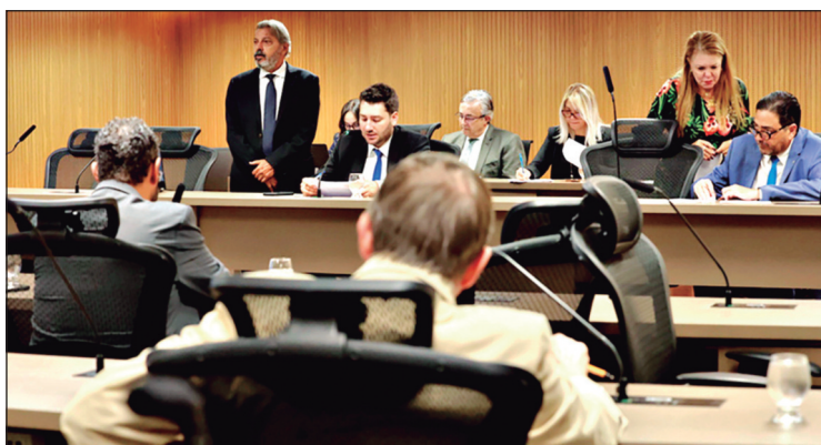
Deputados discutem em plenário proposta que prevê o fim da chamada "Taxa do Agro", cuja tramitação voltou à CCJ após apresentação de emenda durante a sessão

pela rejeição da emenda apresentada. O deputado argumentou que o projeto é resultado de diálogo e construção conjunta. "Por isso, eu não vou modificar um projeto que foi elaborado com tanta dedicação", justificou.