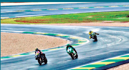
Pilotos aprovam mudanças no Autódromo de Goiânia

✓ O Goiás está negociando sua saída da Liga Forte e União, e trabalha para acertar o retorno às transmissões com a Rede Globo de Televisão. O clube da Serrinha estuda a possibilidade de realizar o pagamento da multa prevista em contrato para rescindir o contrato atual com a liga.